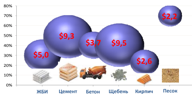
Объем и темпы роста сегментов рынка в млрд. долл.

Модульная структура Исследования " Строительная отрасль России: жилищное, торговое, промышленное, дорожное и инфраструктурное строительство " позволила нам сформировать не только комплексную развернутую версию продукта, но и специальные предложения, которые удовлетворяют потребности компаний, работающих в отдельных сегментах строительного рынка. В первую очередь, речь идет об отраслевых версиях в сегменте промышленного, торгово-административного, дорожного инфраструктурного и жилищного строительства, каждая из которых содержит подробный анализ ситуации в отрасли, рейтинг компаний и описание крупнейших игроков. Также разработаны 2 специальные версии: по рынку строительных материалов и макроэкономическая версия, которую мы называем краткой.