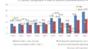
Отгрузка продукции в нефтегазовой промышленности