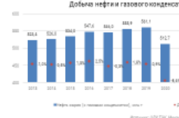
Добыча нефти и газового конденсата