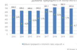
Добыча природного и попутного газа